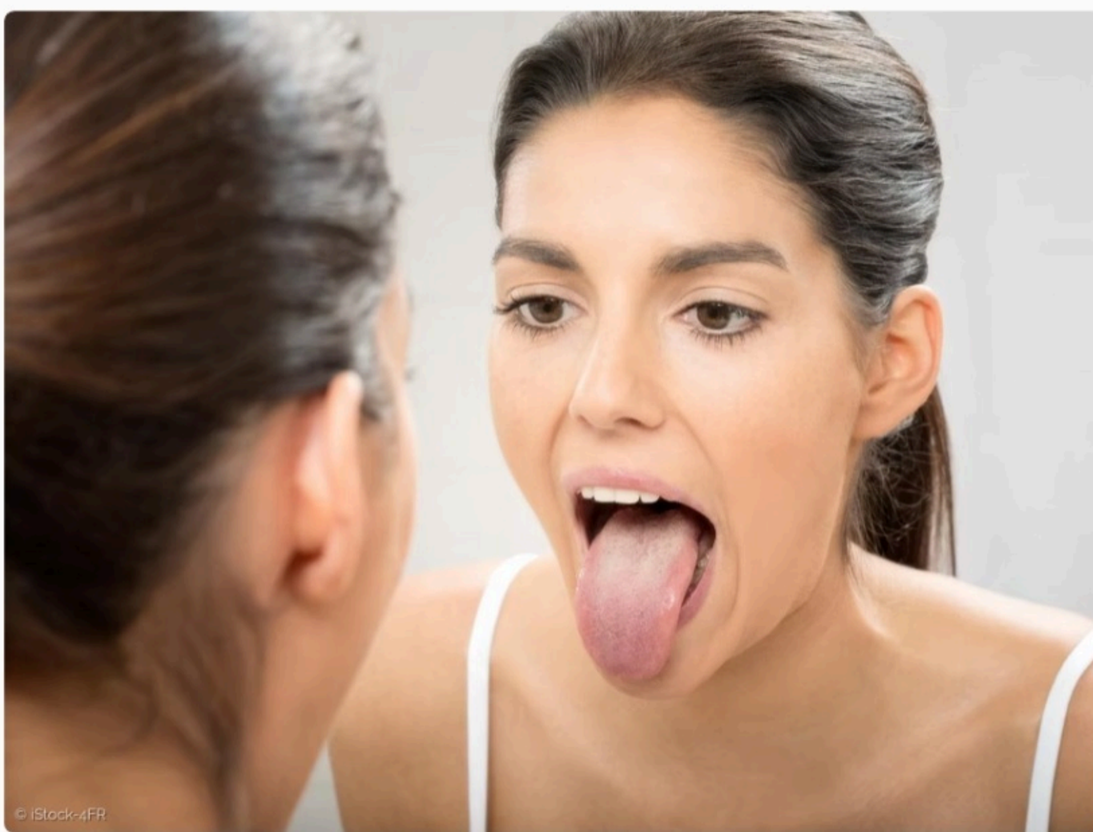
Zungenkrebs ist die häufigste Form des Mundhöhlenkarzinoms.

Von Jasmin Bannan-Döblitz 30.01.2024, 11:32 Uhr